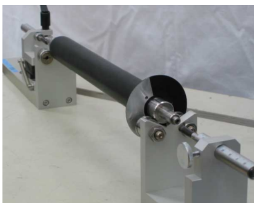
(着脱式マーク付円盤)